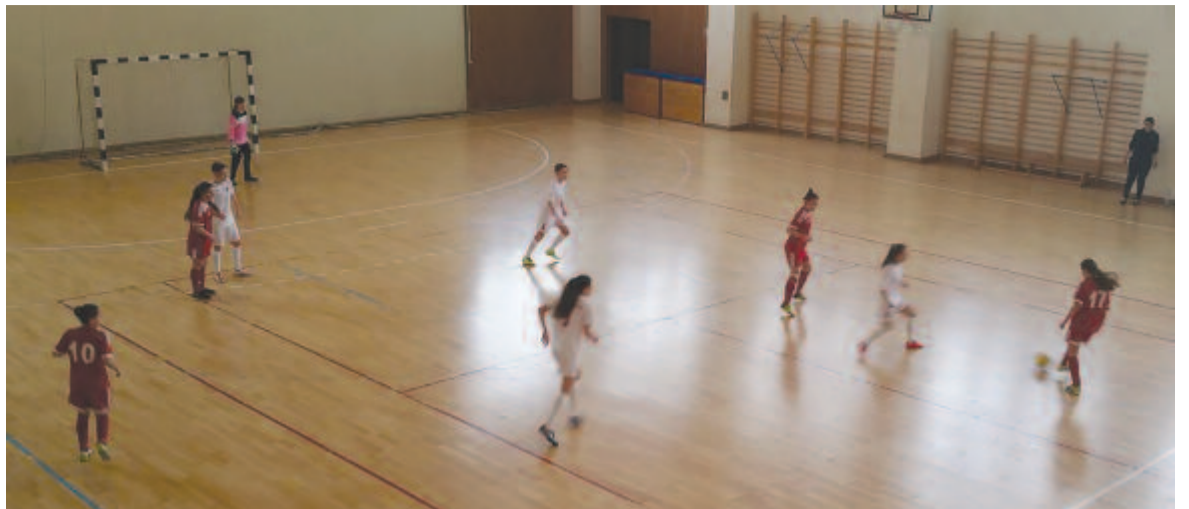
Lehet, hogy sporttörténelmi alkalom: a szövetségben a székelyudvarhelyi tornán látottak alapján (is) döntenek arról, van-e lehetőség a női futsalbajnokság beindítására.

Cristian Vornicu nem titkolta a főderáció honlapjának nyilatkozva, hogy képet szeretnének kapni a csapatok képességeiről, hogy annak alapján eldöntsék: lehetséges lenne-e a női futsalbajnokság beindítása. Harmadrészt, és ez sem mellékes szempont, hogy mivel a részt vevő csapatok többsége a nagypályás bajnokságok állandó szereplője, ezáltal játéklehetőséget biztosítottak számukra a téli idényszünetben.