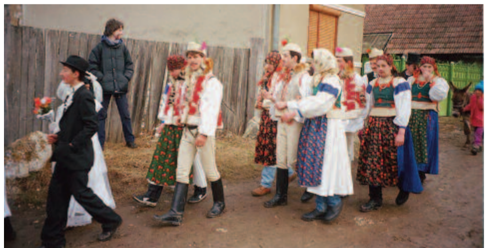
A torockói párok vonulása (2000)

játék abból állt, hogy bevonultak és énekelve körbetáncoltak a szobában. Kétszeri körbetáncolás után bemutatkoztak, felhajtották csipke álarcukat. A falujárás után visszatértek az elindulási helyre, és együtt mulattak. A multság az elmúlt évtizedekben átévődött a művelődési otthonba, a szokásjáték pedig bálba való hívogatássá alakult. Sámsondon három bált tartanak a farsangon: egyet a ma-