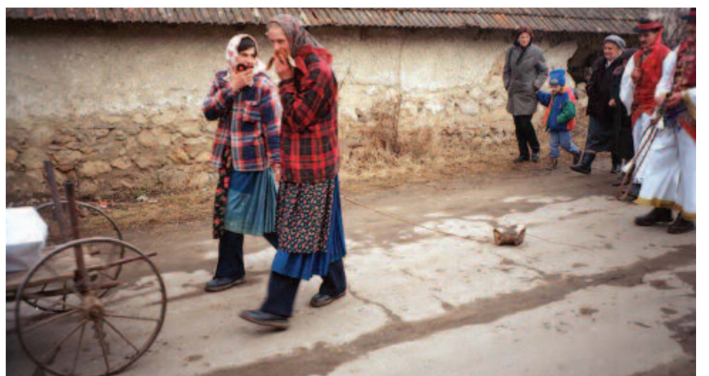
Vénleányok öltözött legények tuskót húznak (Torockó, 2000)

A küllőmenti kibédi változatban a szimbolikus nász megtestesítői a szépek, a szép párok. A szépeket négy pár alkotja: a fehér bővér (vőlegény) a menyasszonnyal, a piros bővér (násznagy) a székely leánnyal, a huszár a leánnyal és az úrfi a kisasszonnyal. A szé-