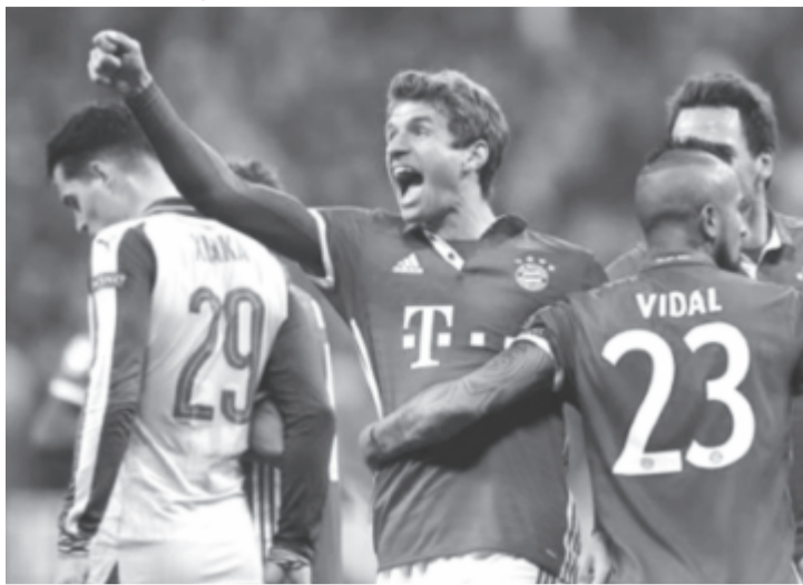
Kevéssel azután, hogy beállt, Thomas Müller megszerezte a Bayern ötödik gólját.

A játék képe a folytatásban sem változott jelentősen, ám a 29. percben Robert Lewandowski szabálytalansága miatt