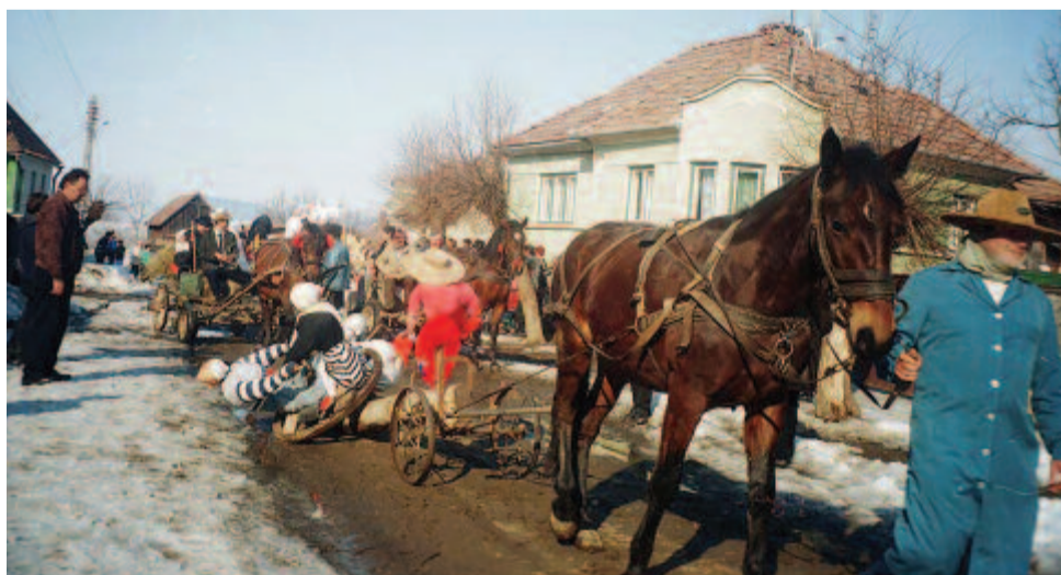
Keréken forgó, ölelkező bábugpárok az utcai menetben (Beresztelke, 2000)

pekhez tartozik két díszesen öltöztetett falovas is. A szépek az utcán vonulnak, és minden felkeresett ház udvarán, tornácán szöktetést táncolnak, majd a vőlegény megtáncoltatja a házileányt. A házaktól adományokat gyűjtnek (kolbászt, szalonnat, tojást), ezeket a bőrálarcos kúdurok szedik össze. Kibédén a szépeket bőrálarcos ostorosok kísérik, védik. Ők vannak a legtöbben, napjainkban tizenketten. A rituális rendtelenség jegyében ők mindent elkövetnek, nagyokat csattintanak, ölelgetik a leányokat. A kibédi szokásjáték tehát egy ünnepélyes, a párosodást szimbolizáló felköszöntésből és egy utcai, inkább bohózat jellegű jelentéssorból áll. Ugyanakkor legénypróba jellege is van, a legénysereg belső hierarchiája szabja meg a játékban való részvételt és a szerepköröket. A szokásjáték egész napos, majd a reggelig tartó farsangi bállal zárul.