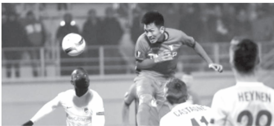
Seto a hajrában egyenlítő jövátette a második belga gólt megelőző hibáját.

A visszavágót február 23-án 22.05 órai kezdettel rendezik. (F.A.)