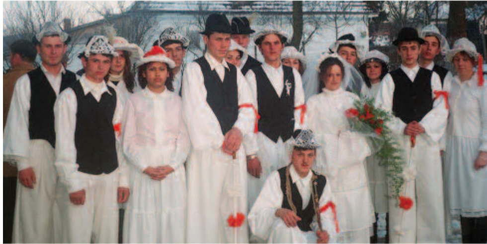
Indulásra készen a mezősámsondi fehér farsáng lakodalmas serege (2007)

házasemberek vehettek részt, de sokkal többen, mint az estéli fonóbeli játékokban. Ezek a szabályok néhány helyen korunkig megmaradtak, legények öltöznek leányoknak is Kibédén, Torockón, Bölönben, Gyergyóditróban, de többnyire feloldódtak. Asszonyok, leányok is aktív résztvevők lehetnek, sőt átvették-átveszik a hagyományos férfiszerepek egy részét, például Alsósófalván és Beresztelkén. Ezek a szokásjátékok és maszkjaik nem egyértelműen „szépek” vagy „csúnyák”, komikusak vagy parodisztikusak, legtöbbjük összetett, szimbolikus jellegű. Bővelkednek humoros-komikus, csúfolódó és erotikus jelképekben, mozzanatokban. Érezhető a szokásalkalomnak, eseménynek kijáró ünnepélyesség, sőt, szertartásosság és mindennek a fordítottja, a játékoság; kitapintható e szokásjátékokat él-