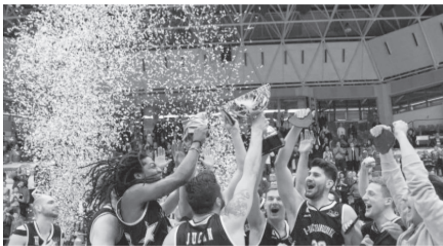
Így ünnepelték a Kolozsvári U játékosai a sikert.

Maros KK: Reed 17 pont, Đapa 14 (3), Martinić 11 (3), Lázár 11, Kalve 9 (1), Ștefan 8 (2), Sánta 6, Borșa 2, D. Popescu, Marković, Cioacă.