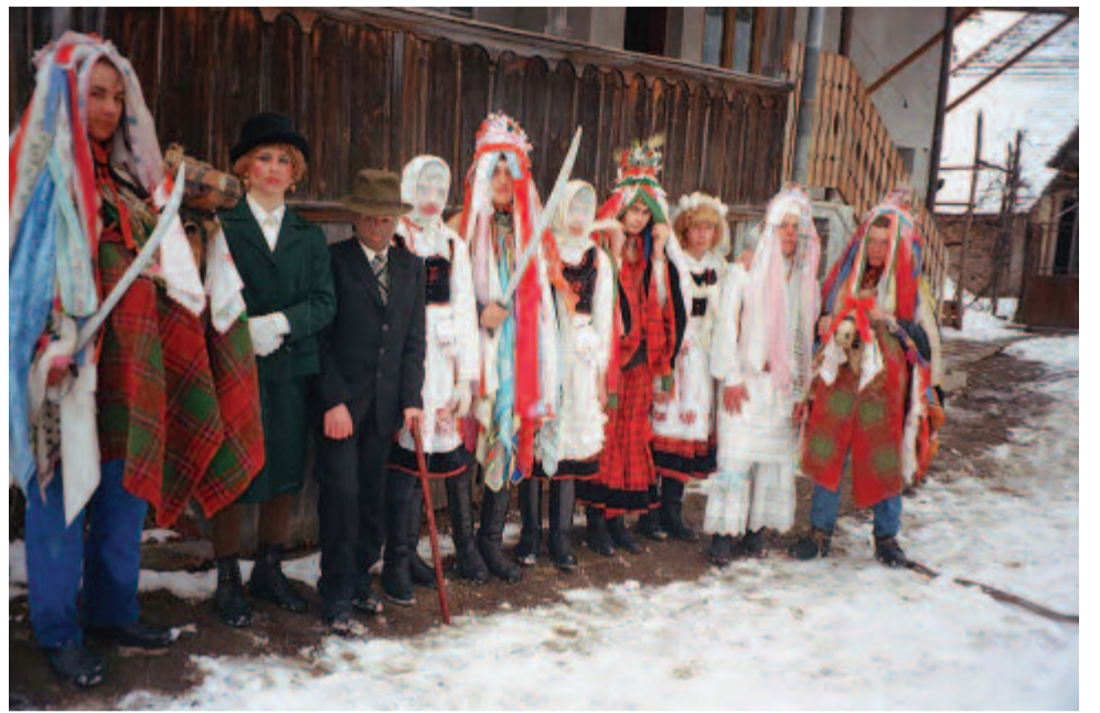
A kibédi szép párok, kétoldalt a piros és a fehér lovas (2000)

De miért farsang végi a szimbolikus lakodalom, kérdezhetnők naivan. Azért, mondaná a szokás rendjének szószólója, mert végig a farsangon valóságos lakodalmakat lehetett és kellett tartani. A népi emlékezet szerint – anyakönyvi adatokkal, statisztikákkal bizonyíthatóan – nem is olyan régen a farsangon tartottuk a legtöbb lakodalmat. Ennek okát a téma kutatói összefüggésbe hozták azzal, hogy valamikor a farsang az új párok egybekelésének nemcsak hagyományos, hanem kö-